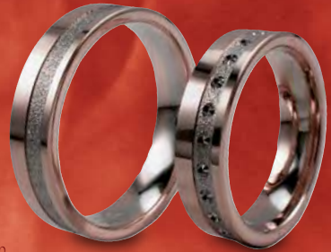
Modell: 81550 5 mm, Rot-/Weiß-/Rotgold mit Punkten