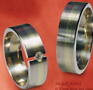
Modell: 82662 6,5 mm breit mit einem Brillanten 0,05 Karat