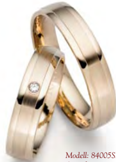
Modell: 84005SM 5 mm breit