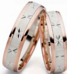
Modell: 516RWR 5 mm breit