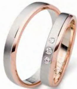
Modell: 81344 3,5 mm breit