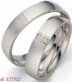
Modell: E77502 4,5 mm breit