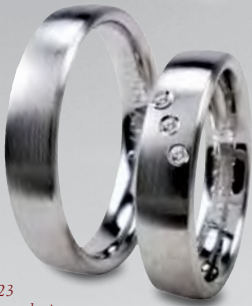
Modell: HW8823 Weißgold und 5 mm breit, 3 Brillanten à 0,01 Karat