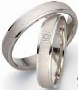
Modell: 81451 4 mm breit