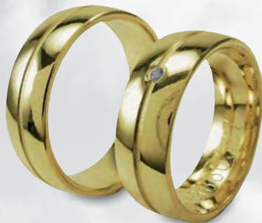
Modell: HG8803 Gewölbter Ring, 7 mm breit mit matter Rille + Brillanten 0,02 Karat