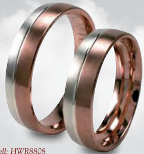
Modell: HWR8808 5,5 mm in Weiß- und Rotgold