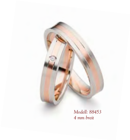
Modell: 88453 4 mm breit