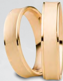
Modell: 592 5 mm breit