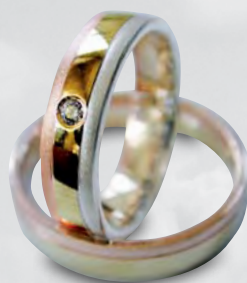
Modell: 82518 5 mm bis 7 mm gewölbter Ring in Rot-/Gelb-/Weißgold mit einem Brillanten nach Wahl