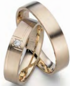
Modell: 84572 5 mm breit