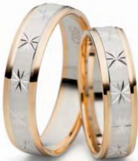
Modell: 516GWG 5 mm breit