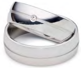
Modell: HW8803 7 mm breit