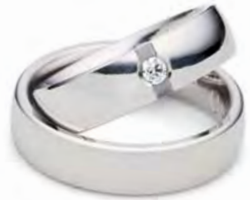
Modell: 86604 6 mm breit