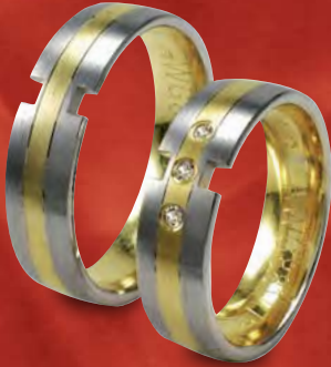
Modell: HWG8814 6 mm breit mit Brillanten 3 x 0,02 Karat