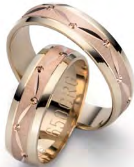
Modell: 650GRG 6 mm breit