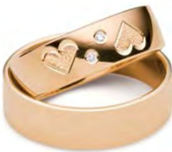
Modell: Herz 1 6 mm breit