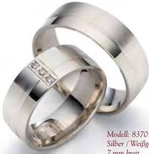
Modell: 83701 Silber / Weißgold 7 mm breit