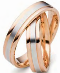
Modell: 82509SM Rot Weiß 5 mm breit