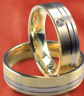
Modell: 82663 6 mm breiter Ring, flach, Gelb-/Weiß-/Gelbgold, ein Brillant in 0,04 Karat