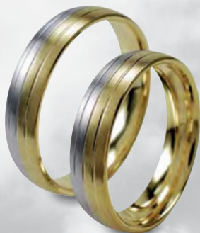
Modell: HWG8804 5 mm breiter Ring in Weiß- und Gelbgold