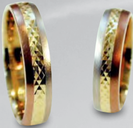
Modell: 81502 gewölbter Ring, 5 mm breit, Weiß-/Gelb-/Rotgold