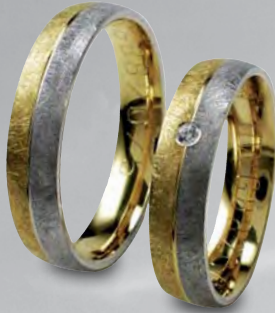
Modell: HWG8820 Eismatter Ring, 5 mm breit, Gelb- und Weißgold mit einem Brillanten 0,02 Karat