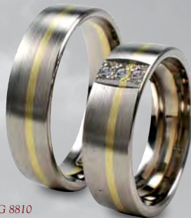
Modell: HWG 8810 flach gewölbter Ring, 6 mm breit, mit 3 Brillanten 0,01 Karat