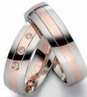
Modell: E77603 6 mm breit