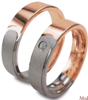
Modell: 81558 5 mm breit