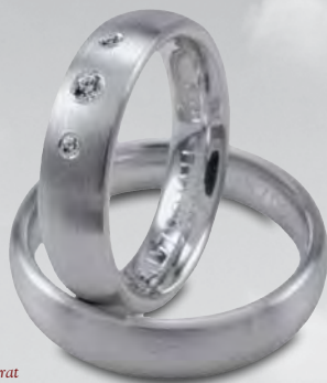
Modell: HW8824 gewölbter Ring, 5,5 mm breit, Weißgold, mit Brillanten 1 x 0,04 und 2 x 0,01 Karat