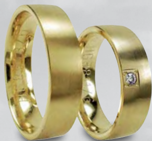
Modell: HG8811 leicht gewölbt, 6 mm breit, Damenring mit einem Brillanten 0,04 Karat