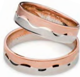
Modell: 88526 5 mm breit