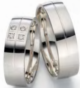
Modell: E77604 6 mm breit