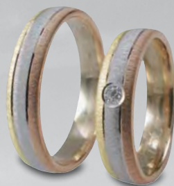
Modell: 87503GWR 5 mm breit