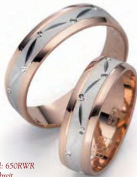
Modell: 650RWR 6 mm breit