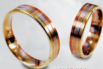
Modell: 81541 flacher Ring in Gelb-/ Weiß-/Rotgold