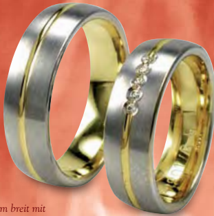
Modell: HWG8801 gewölbter Ring 6,5 mm breit mit 5 Brillanten á 0,01 Karat