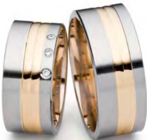
Modell: 82964 9 mm breit