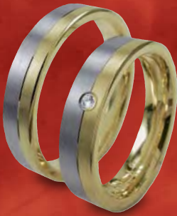
Modell: H1543 flacher Ring, 5 mm breit, Gelb- und Weißgold, mit Brillant 1 x 0,02 Karat