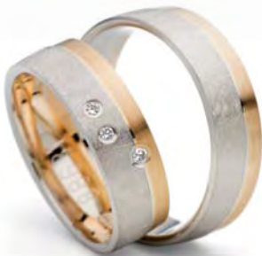
Modell: 88631 6 mm breit