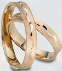
Modell: 3456 4 mm breit