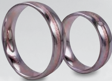
Modell: 81551 5,5 mm breiter Ring mit einem Brillanten 0,04 Karat in Weiß-/Rot-/Weißgold