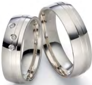
Modell: E77601 6 mm breit