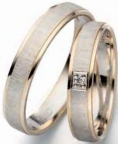
Modell: 88451 4 mm breit