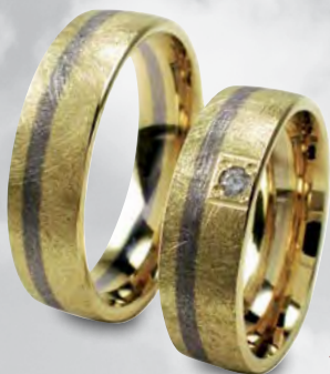
Modell: HWG 8811 flach gewölbt und 6 mm breit, ein Brillant mit 0,04 Karat