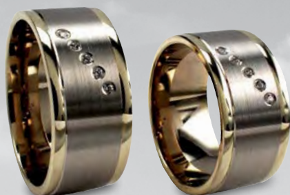
Modell: 86609 10 mm breit, mit fünf Brillanten à 0,01 Karat