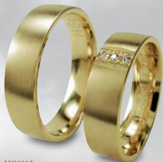
Modell: HG8810 leicht gewölbt, 6 mm breit Damenring mit 3 Brillanten à 0,01 Karat