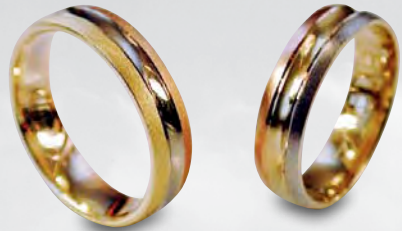
Modell: 81504 gewölbter Ring, 5 mm breit, Gelb-/Weiß-/Rotgold