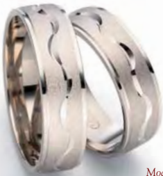
Modell: 85626FM 6 mm breit