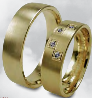
Modell: HG8813 Leicht gewölbter Ring, 6 mm breit Damenring mit 4 Brillanten à 0,02 Karat