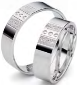
Modell: 3654WG 6 mm breit