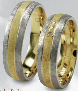
Modell: HWG8802 6 mm breiter Ring mit drei Brillanten à 0,01 Karat in eismatt