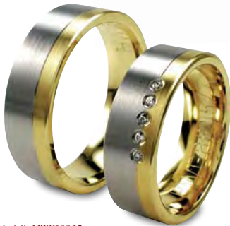
Modell: HWG8805 7 mm breit