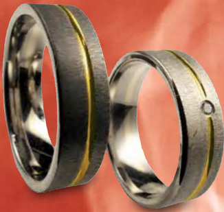
Modell: 87660 flacher 6 mm breiter Ring, querstrich matt, mit 1 x 0,02 Karat