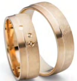
Modell: 88632 6 mm breit