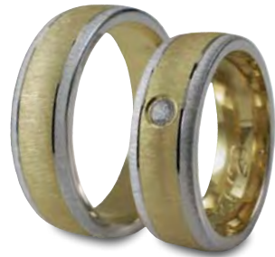
Modell: 87720 7 mm breit