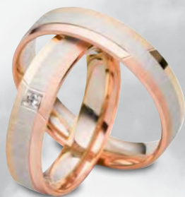
Modell: 88501RWG 5 mm breit