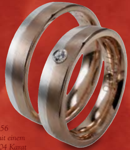
Modell: H1556 5 mm breit mit einem Brillanten 0,04 Karat