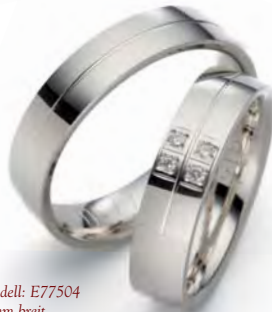
Modell: E77504 5 mm breit