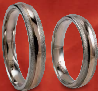
Modell: 81449 4 mm breit in Weiß-/Rot-/Weißgold