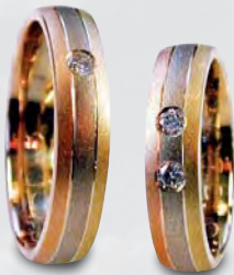
Modell: 81503 gewölbt, Gelb-/Weiß-/Rotgold, Steine nach Wahl