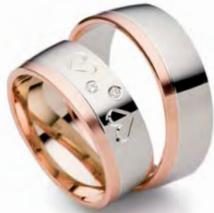
Modell: Herz 2 5,5 mm breit