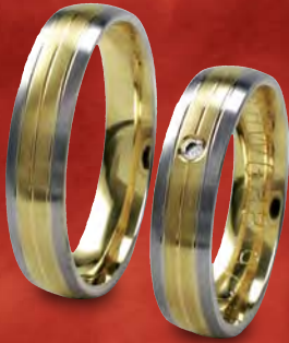
Modell: HWG8849 gewölbter 5 mm Ring mit einem Brillanten 0,02 Karat