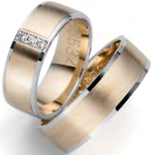
Modell: 88634 6,5 mm breit