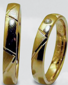
Modell: 84420 gewölbter Ring mit 4 mm Breite, ein Brillant in 0,04 Karat