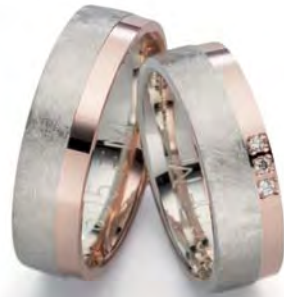
Modell: E77605EM 6 mm breit