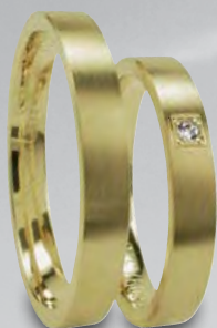
Modell: HG8809 Flacher Ring, 3,5 mm mit Brillant 0,02 Karat