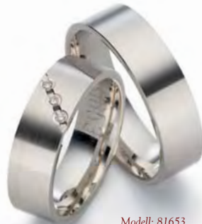
Modell: 81653 6 mm breit