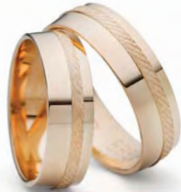
Modell: 88633 6 mm breit