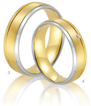
3 41740/6 4 41740/6B