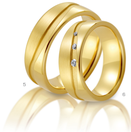
5 41742/7 6 41742/7B